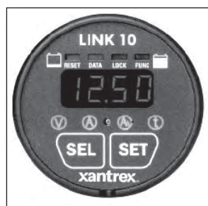
Xantrex Link 10