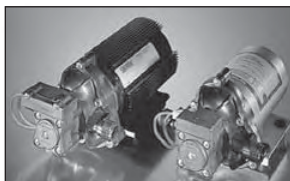
Bomba Superficial SHURflo 2088