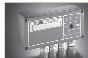
Controlador SHURflo 902-200