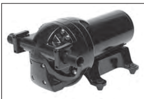
Bomba SHURflo Serie 5900

La bomba sumergible modelo 9300 proporciona muchos años de servicio y puede reconstruirse en el campo con herramientas sencillas. Esta bomba es la favorita de ganaderos, misionero y propietarios de viviendas remotas ya que sólo necesita un pequeño arreglo solar y es de fácil uso. Produce cerca de 3.8 LPM desde una profundidad de 67 metros. 1 año de garantía.