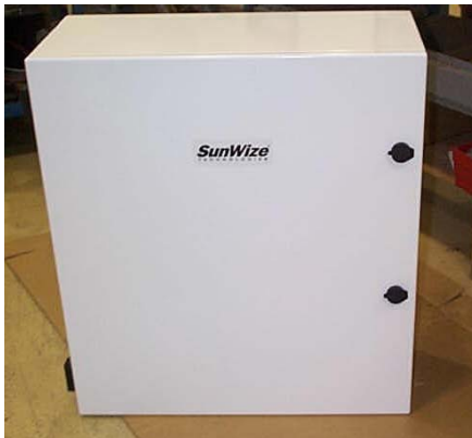
Albergue de uso rudo es resistente a la intemperie.

Debido a esta experiencia las compañías de telecomunicaciones acuden a nosotros buscando soluciones para sus localidades conectadas a la red. Una de estas compañías construye un dispositivo de RF para extender su cobertura celular.