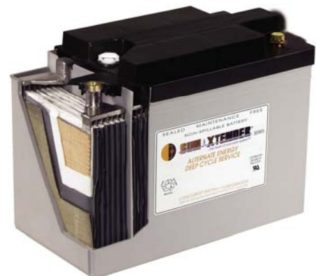
Batería VRLA AGM Concorde.

ción adecuada. Estas baterías están cargadas en seco (el electrolito va aparte) para su envío al extranjero.