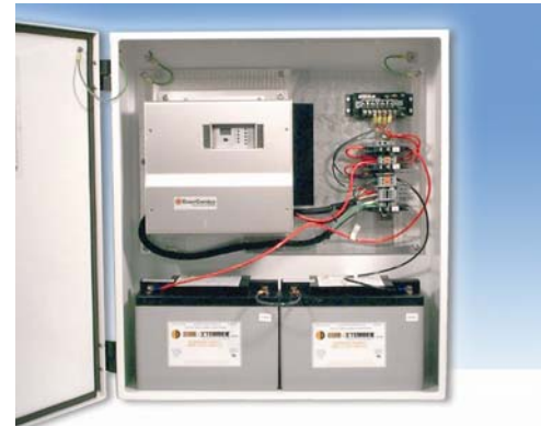
Fuente de Potencia DC SoListo de 20 amp, 24 volt con Baterías VRLA AGM Concorde.

Los sistemas SoListo incluyen luces indicadoras de status y una alarma de fallas cuando se interrumpe la corriente de la red, notificando al usuario que el sistema está ahora en modo UPS.