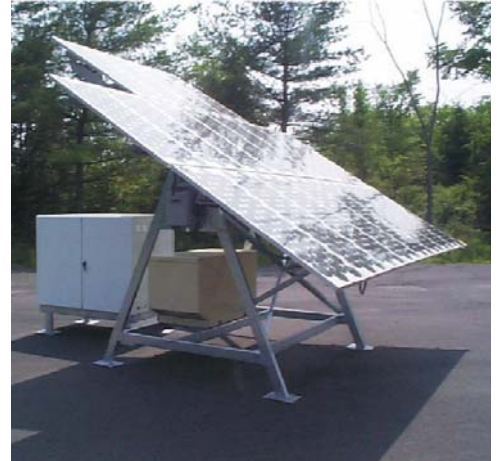
Un sistema híbrido FV/Generador en una localidad de la Patrulla Fronteriza.

Si su necesidad está entre 300 y 200 Watts, puede agregar un sistema FV a su generador para crear un sistema híbrido FV/Generador. En un sistema híbrido, cada fuente contribuye regularmente a las